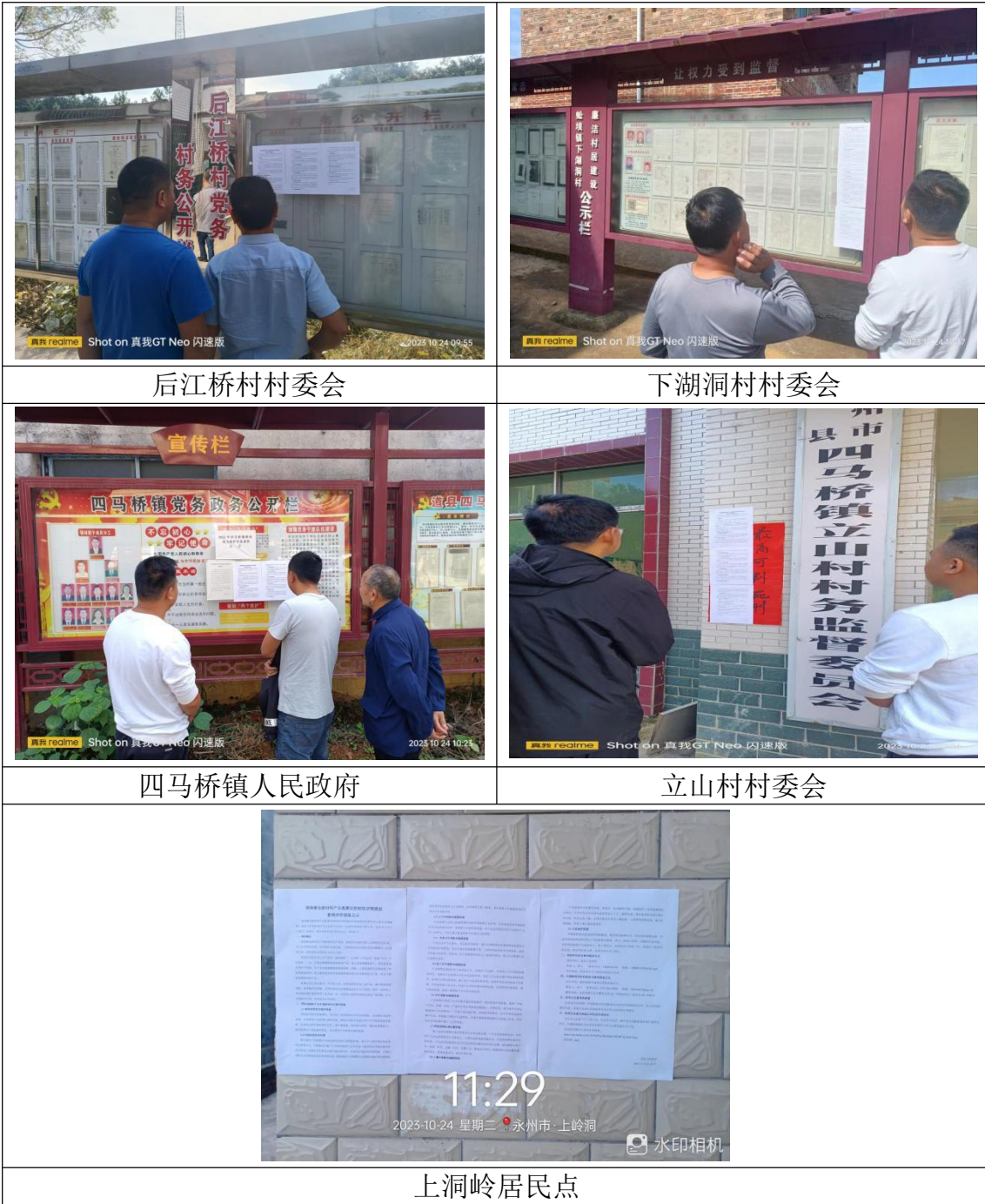
图 13.3-3 现场公告照片